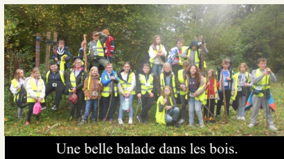
Une belle balade dans les bois.

Après avoir piqué dans un parc et joué un peu, la troupe des Colibris a pris la route à travers les bois pour rejoindre le gîte de Brûly-de-Pesche.