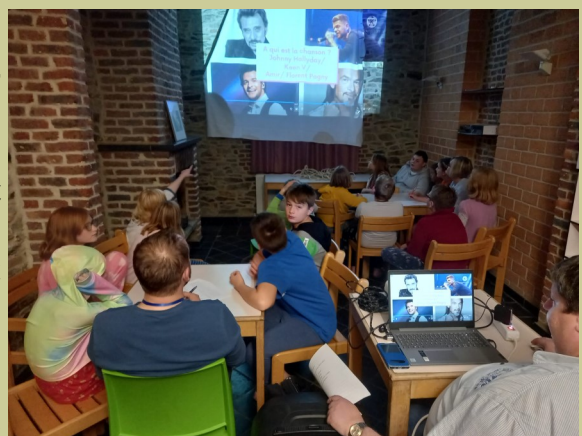
Blind Test et Karaoké ont ravi petits et grands.

Après le jeu, nous avons chanté au karaoké. Il y avait une très belle ambiance.