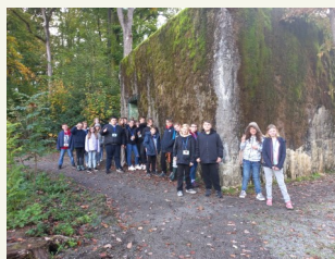
Le bunker d'Adolphe Hitler à Brûly-de-Pesche.