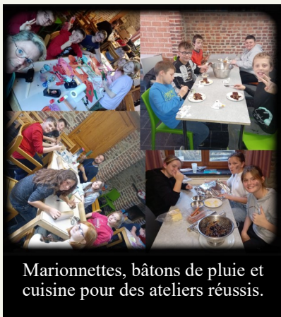
Marionnettes, bâtons de pluie et cuisine pour des ateliers réussis.

Le matin les deux groupes ont préparé les pizzas pour le dîner. Pizzas jambon/fromage, pizzas jambon/fromage/champignons, pizzas jambon/fromage/ananas.