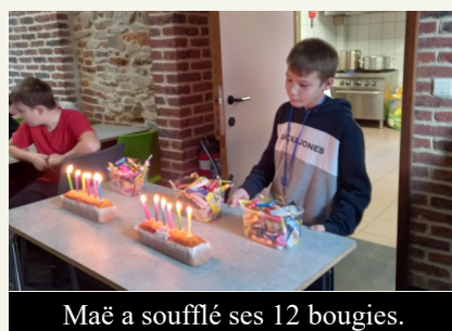
Maë a soufflé ses 12 bougies.

ses camarades durant la classe verte. C'est ainsi que ce mardi 18 octobre, il a soufflé ses 12