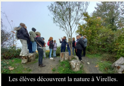
Les élèves découvrent la nature à Virelles.

Mercredi 19 octobre on se lève avec le brouillard. Départ 9h30 en bus. Tout le groupe est au rendez-vous pour une journée exceptionnelle à Virelles.