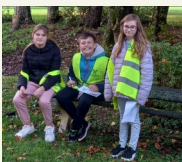
Un vrai casse-tête cet escape games

(français, math...) à réaliser afin de trouver un texte codé qui permettait d'ouvrir la porte de notre gîte lors de notre retour.