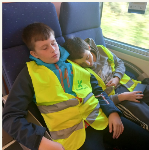
Bien fatigués par cette semaine de classe verte, les enfants se sont pris une petite pause bien méritée dans le train.

Nous avons eu quelques péripéties sur la ligne Charleroi-Tournai, ce qui a provoqué du retard. Enfin, tout ce monde descend pour la dernière ligne droit : l'école. Les parents sont là, les bus aussi. Quelle joie de se retrouver. Fatigués mais en ayant des souvenirs plein la tête.