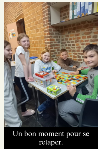
Un bon moment pour se retaper.