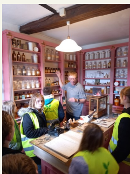
Les élèves ont entre-autre, découvert une ancienne pharmacie.

expliquer l'utilité d'objets d'antan et l'évolution de ceux-ci. La visite était très enrichissante et nous a permis de se projeter dans les siècles passés.