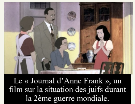
Le « Journal d'Anne Frank », un film sur la situation des juifs durant la 2ème guerre mondiale.

Après le repas, une projection du film « Anne Frank » leur a été proposée. Après cette journée chargée, chacun a profité d'une bonne nuit de sommeil.