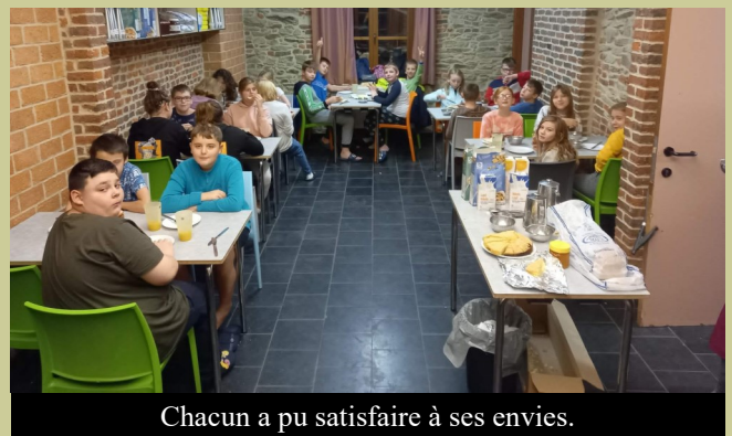
Chacun a pu satisfaire à ses envies.

Pour être en forme toute une journée rien de tel qu'un bon petit déjeuner !