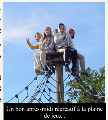
Un bon après-midi récréatif à la plaine de jeux.

A la plaine de jeux, il y avait une toile d'araignée. Certains sont montés jusqu'en haut pour observer l'horizon. D'autres se sont amusés sur les balançoires, le pont chinois, la fontaine à eau. Il y avait aussi la tyrolienne. C'était une journée très chouette.