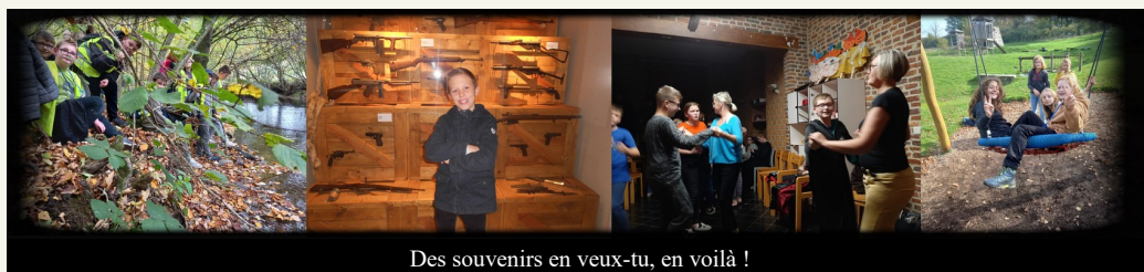
Des souvenirs en veux-tu, en voilà !

« Les activités de la dernière journée, c'était trop bien. » (Anna Z.)