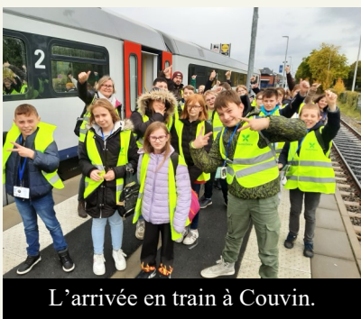
L'arrivée en train à Couvin.

C'est le lundi 17 octobre 2022 que les 23 élèves se sont lancés dans l'aventure en prenant le train au départ de la gare de Tournai. Après deux bonnes heures de route, le groupe est arrivé en gare de Couvin où M.