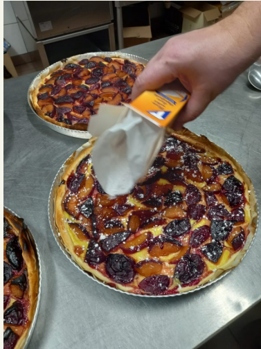
Nos belles tartes aux prunes de classe verte. Hum, un régal !

1. Préparer la crème pâtissière : Faire chauffer le lait et le sucre, dans une tasse mettre du lait froid et mélanger avec la poudre Impérial. Lorsque le lait bout,